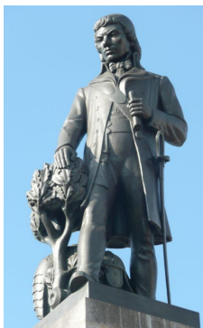
Figura Kościuszki z łódzkiego monumentu (fot. Brücke-Osteuropa, domena publiczna).

Do pomysłu budowy pomnika Naczelnika powrócono wkrótce po odzyskaniu niepodległości w 1918 roku. Podjęto decyzję, że pomnik stanie na placu Wolności. W 1921 r. ogłoszono konkurs na projekt pomnika, jednak żadna z zaprezentowanych prac nie spodobała się organizatorom. Dwa lata później ogłoszono drugi konkurs. Zmieniono też lokalizację. Pomnik miał tym razem powstać w parku na Zdrowiu, który jednocześnie miał mieć zmienioną nazwę na Park Ludowy im. Tadeusza Kościuszki. Do realizacji zwycięskiego projektu autorstwa Władysława Czaplińskiego jednak nie doszło ze względu na sprzeciw wiceprezydenta Łodzi Wiktora Groszkowskiego, według którego T. Kościuszkę powinien być przedstawiony na koniu.