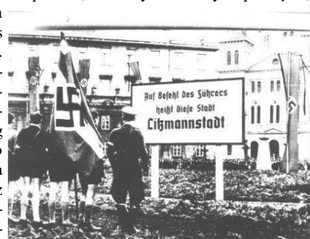
11 kwietnia 1940 r. przemianowano Łódź na Litzmannstadt (tablica ustawiona na pl. Wolności).