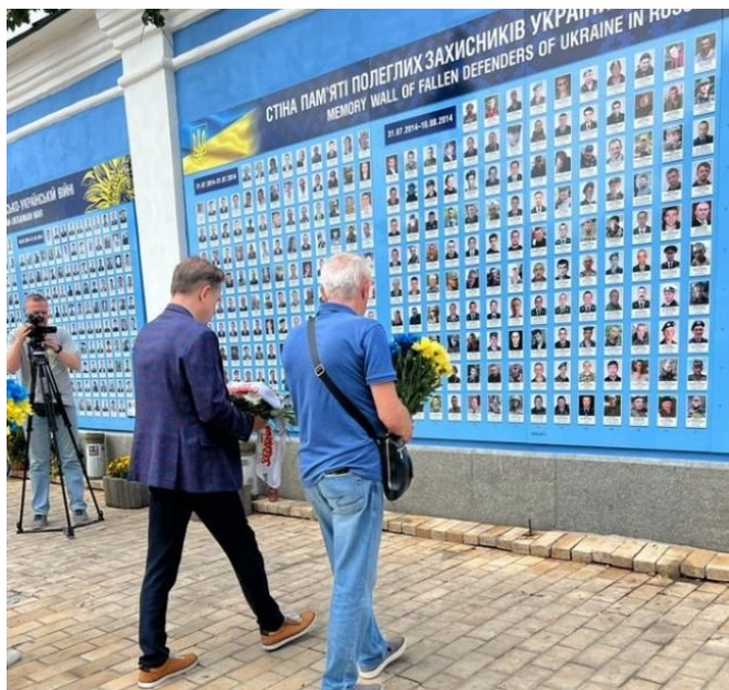
Złożenie kwiatów pod ścianą pamięci poległych żołnierzy

ukraińscy w Polsce, mieli takie same prawa, jak polscy pracownicy. „Solidarność” współpracuje w tym zakresie z polskim rządem i prezydentem RP. Rozmowy z ukraińskimi związkami zawodowymi zakończono podpisaniem memorandum o ścisłej współpracy z Konfederacją Wolnych Związków Zawodowych Ukrainy. „Liderzy Niezależnego, Samorządnego Związku Zawodowego „Solidarność” oraz Konfederacji Wolnych Związków Zawodowych Ukrainy wzywają całą międzynarodową społeczność związkową do okazania solidarności i udzielenia wszelkiego wsparcia dla walczącej Ukrainy, dla Ukrainy broniącej podstawowych europejskich i cywiliza-