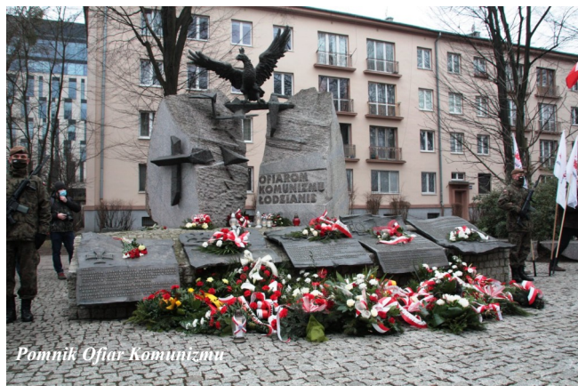
Pomnik Ofiar Komuny

1 marca obchodzimy Narodowy Dzień Pamięci „Żołnierzy Wyklętych”. W Polsce jest wiele miejsc upamiętniających bohaterów tamtych lat, walczących o wolną Polskę. Są pomniki, tablice pamiątkowe. Imionami poszczególnych bohaterów nazwane są ulice miast, ronda, skwery, szkoły, powstają murale. Co roku, 1 marca odbywają się uroczystości u stóp pomników, krzyży, tablic - składane są kwiaty, zapalane są znicze. PAMIĘTAMY!