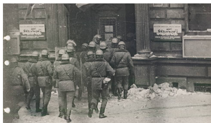
13 grudnia 1981 r. siedziba łódzkiej „Solidarność” przy ul. Piotrkowskiej 258

Jeszcze tego samego dnia, 13 grudnia, liderzy związkowi zostali aresztowani.