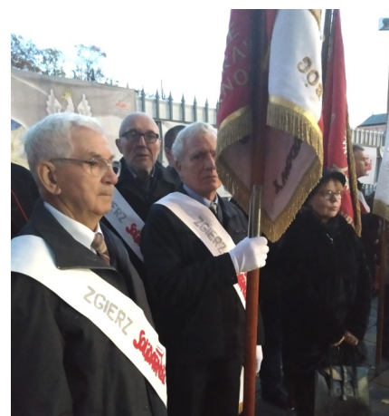
Na zdjęciach poczty sztandarowe przy grobie ks. J. Popiełuszki.

19 października, br. w 37. rocznicę błogosławionego ks. Jerzego Popiełuszki hołd zamordowanemu złożyli także przedstawiciele „Solidarność” ze Zgierza i Ozorkowa wraz Pocztaami Sztandarowymi.