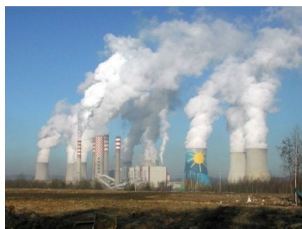
Elektrownia Turów

Publikujemy w całości stanowisko Walnego Zebrania Delegatów Regionu Jeleniogórskiego NSZZ „Solidarność” w sprawie ataku na kompleks górniczo-energetyczny Turów.