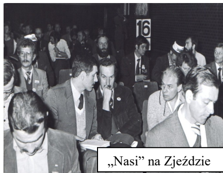
„Nasi” na Zjeździe

Wśród delegatów znalazło się ponad stu członków PZPR, a także kilkunastu SD oraz kilku ZSL. O porządek na sali obrad dbała Harcerska Służba Zjazdu.