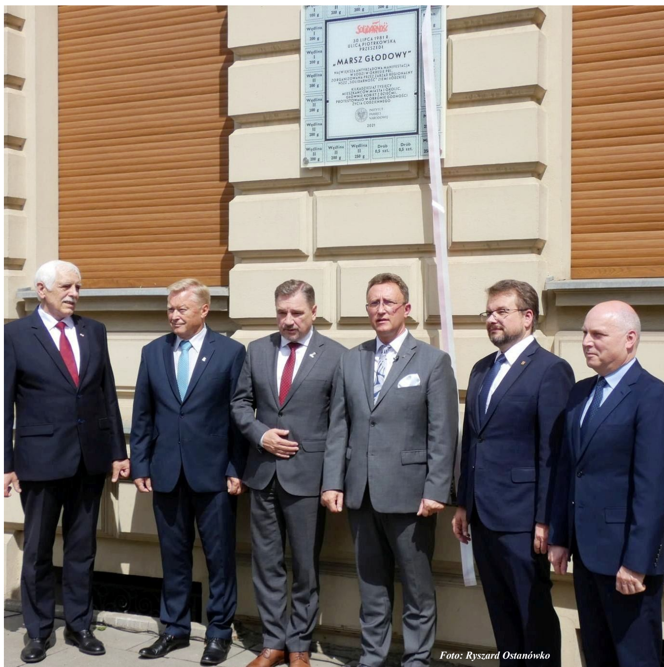
Odślonięcie Tablicy Pamiątkowej przypominającej zorganizowany przez NSZZ „Solidarność” Marsz Głodowy w lipcu 1981 roku.