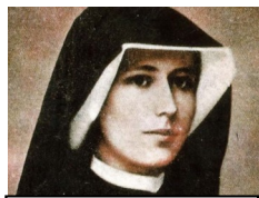
Patronka Łodzi św. Faustyna

Odzyskanie przez Polskę niepodległości w 1919 r. umożliwiło uporządkowanie administracji kościelnej. I tak 10 grudnia 1920