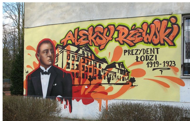
Mural na SP w Łodzi ul. Ratajska 2/4 upamiętniający A. Rzewskiego.

W 1996 r. nazwano imieniem A. Rzewskiego jedną z ulic na łódzkich Rogach, a także od 2004 r. - Szkołę Podstawową nr 116 w Łodzi.