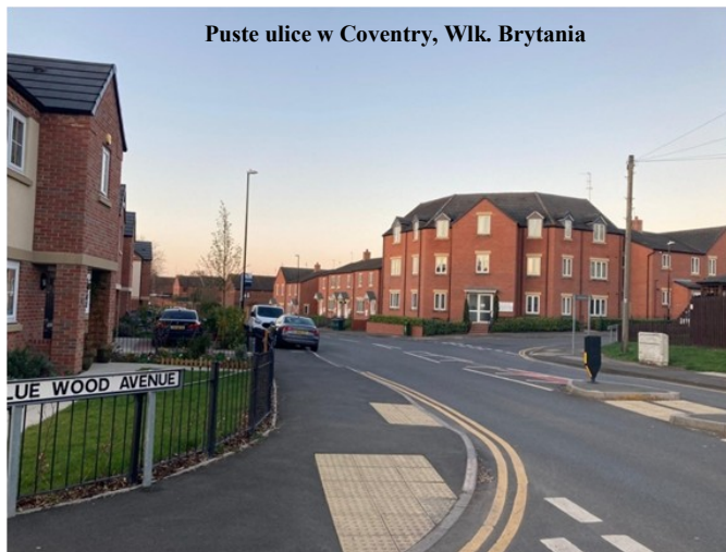
Puste ulice w Coventry, Wlk. Brytania

niemożliwe. Po raz pierwszy od wielu, wielu lat, spędzaliśmy święta w Anglii. Był to smutny i trudny czas. Staraliśmy się pocieszać się tym, że przecież jesteśmy zdrowi, mamy co jeść, gdzie mieszkać, nic nam nie grozi. Jednak brakowało tej atmosfery i ciepła, które jest możliwe tylko w rodzinnym domu, wśród osób nam bliskich. Podczas pandemii pojawił się też strach o siebie nawzajem, o zdrowie i życie. I ta ciągła myśl - kiedy to się wreszcie skończy, kiedy znów się zobaczymy, wyściskamy, kiedy będziemy znowu razem? Teraz, kiedy wszystko powoli wraca do normy, nie czujemy jednak ulgi, nie jesteśmy na tyle odważni, żeby odetchnąć. I myślę, że tak już zostanie. Ta covidowa mgła, będzie się za nami ciągnąć, przypominając nieustannie, że nic nie jest w życiu pewne, nic tak do końca nie wiadomo. Nasze spotkania z rodziną będą teraz jeszcze bardziej intensywne, będziemy z siebie czerpać do ostatniej chwili, do ostatniego uścisku. Żyjemy nadzieją, że nastąpi to już niedługo.