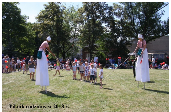
Piknik rodzinny w 2018 r.

Postanowiliśmy organizować spotkania atrakcyjne dla rodzin pracowników PŁ – i tak powstały: