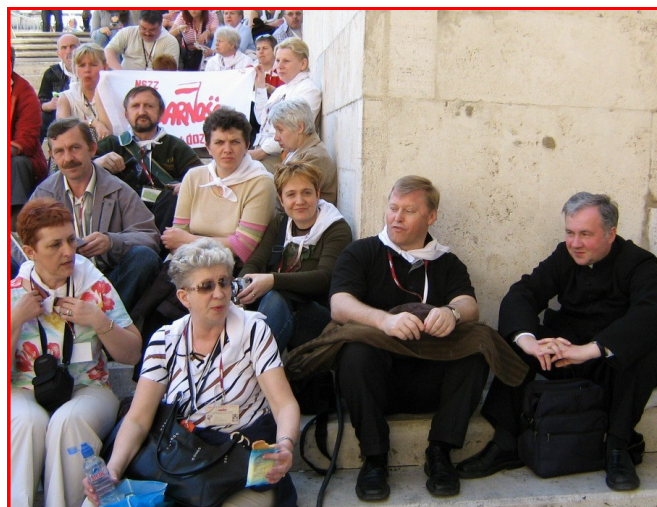
Pielgrzymka łódzkiej „Solidarności” do Rzymu pod duchowym przewodnictwem ks. Grzegorza

Ks. G.M. To nie tylko związek zawodowy, ale wartości, które wprost wypływają z Ewangelii. To zryw ludzi, którzy doprowadzili do odzyskania suwerenności przez Polskę.