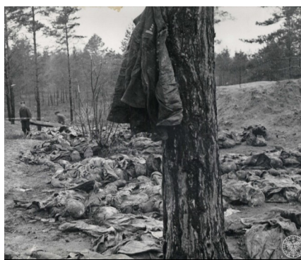
Ekshumacja zwłok polskich oficerów po odkryciu masowych grobów w Lesie Katyńskim w 1943 r.

Mimo, że dla wielu było jasne, kto stał za zbiorowym mordem, Zbrodnia Katyńska oficjalnie bardzo długo kryła swą mroczną tajemnicę. Dopiero w kwietniu 1990 r. Michaił Gorbaczow oznajmił, że winę za nią ponosi Związek Radziecki. Do tej pory, przez prawie pół wieku, kolejni przywódcy ZSRR nie robili nic, aby ujawnić prawdę, a ich stanowisko wobec faktu dokonania masowego mordu można wyrazić słowami Józefa Stalina z kwietnia 1943 r., wygłoszonymi po odkryciu masowych mogił przez Niemców: „Władze hitlerowskie, które popełniły monstrualną zbrodnię wobec oficerów polskich, odgrywają komedię sądową i do jej wyreżyserowania użyli pewnych polskich elementów profaszystowskich [...] Ta wroga kampania została zorganizowana po nawiązaniu kontaktu i wcześniejszym porozumieniu między Hitlerem, wrogiem Aliantów, i rządem Sikorskiego.”