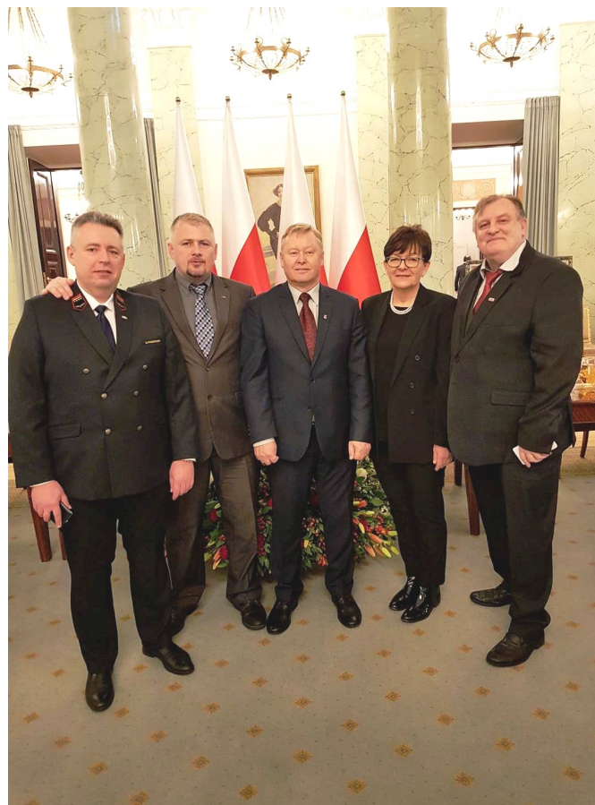
Delegacja NSZZ „Solidarność” Regionu Ziemia Łódzka podczas spotkania w Pałacu Prezydenckim

źródło: www.solidarnosc.org.pl ; prezydent.pl ;