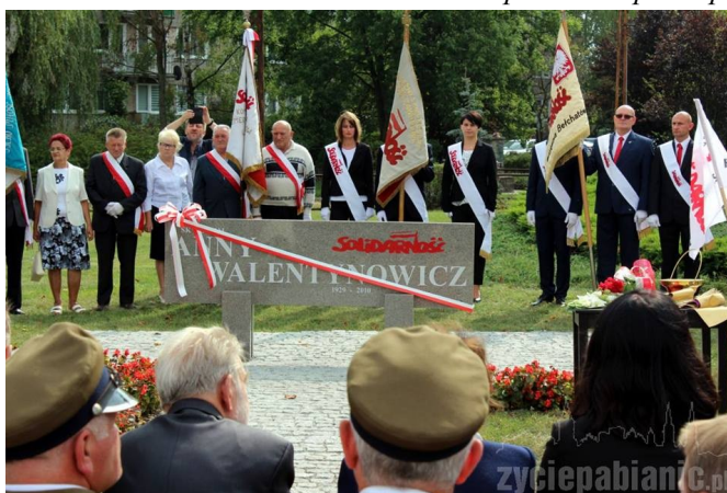
Na zdjęciu: 17 września 2016 r. odsłonięcie tablicy Pamiątkowej w Pabianicach

Ze smutkiem zawiadamiamy, że 21 lutego 2019 roku zmarł