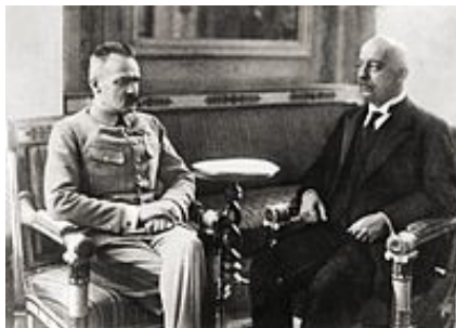
Józef Piłsudski i Gabriel Narutowicz

W ustanowionym 14 listopada dekretem własnym Naczelnny Dowódca zmienił nazwę państwa na Republika Polska.