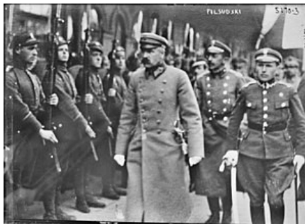
Józef Piłsudski podczas przeglądu oddziałów

Piłsudski w tym czasie był głównym twórcą orientacji antyrosyjskiej, planującej przy pomocy Austro-Węgier doprowadzenie do uzyskania przez Polskę niepodległości. Z tajnego Związku Walki Czynnej Józef Piłsudski zorganizował w 1910 r. w Galicji legalne stowarzyszenie paramilitarne Związek Strzelecki, którego został Komendantem i przyjął pseudonim Mieczysław . Był to pierwszy załęczek odrodzonego Wojska Polskiego. W młodych ludziach budziła się duma. Mieli mundury, czapki – maciejówki z orzełkiem, a przede wszystkim dzielnego Komendanta. To wówczas powstały znane pieśni śpiewane do dziś z dreszczem emocji: O mój rozmarynie , Przybyli ulani , a kilka lat później My pierwsza brygada (1917).