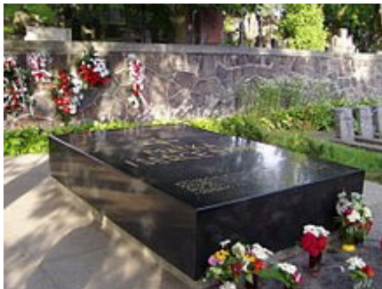
Cmentarz Na Rossie w Wilnie, mauzoleum Matka i Serce Syna,

liczby orderów i odznaczeń zarówno polskich, jak i zagranicznych. M.in.: Order Orła Białego (1921), Krzyż Wielki Orderu Wojskowego Virtuti Militari nr 1 – 14 czerwca 1923 „jako Wodzowi Naczelnemu za zwycięską wojnę