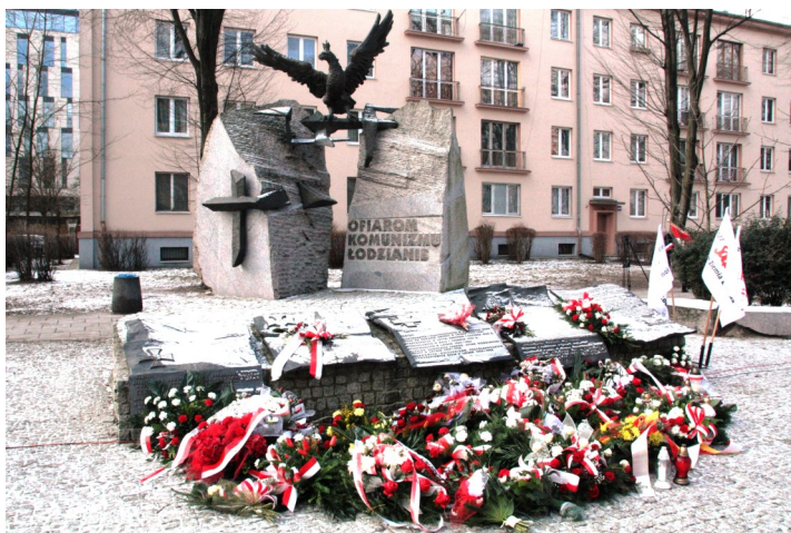
1 MARCA - Narodowy Dzień Pamięci Żołnierzy Wyklętych

Zarząd Regionu Ziemi Łódzkiej był organizatorem obchodów świąt i rocznic związkowych i narodowych, za co m.in. został uhonorowany Nagrodą „Świadek Historii”