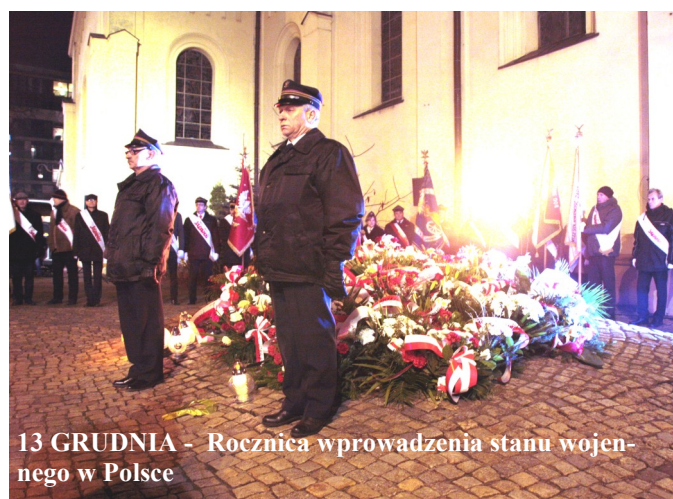
13 GRUDNIA - Rocznicą wprowadzenia stanu wojennego w Polsce

ŚWIATOWY DZIEŃ PAMIĘCI OFIAR WYPADKÓW PRZY PRACY I CHOROÓB ZAWODOWYCH