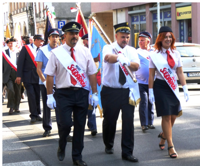
31 SIERPNIA - Rocznicą podpisania Porozumień Sierpniowych

11 LISTOPADA - Narodowe Święto Niepodległości