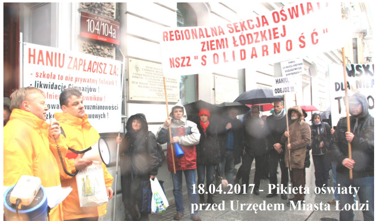
18.04.2017 - Pikieta oświaty przed Urzędem Miasta Łodzi