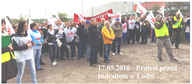
17.05.2016 - Protest przed Indesitem w Łodzi