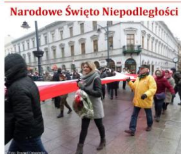
11 listopada 2016 r., z okazji 98. rocznicy odzyskania niepodległości przez Polskę, odbył się Łódzki Marsz Niepodległości zorganizowany przez Społeczny Komitet Obchodów Rocznic i Świąt Narodowych im. Grzegorz Palki oraz Zarząd Regionu Ziemi Łódzkiej NSZZ „Solidarność”. Uczestnicy marszu niosąc 50-metrową biało-czerwoną flagę przeszli ulicą Piotrkowską spod łódzkiej Archikatedry przed Pomnik Marszałka Józefa Piłsudskiego. (więcej na str. 3 i 6-7)