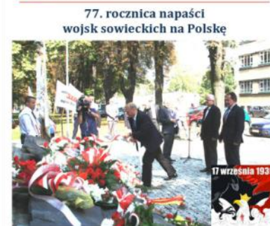
16 września odbyły się pod Pomnikiem Ofiar Komunizmu w Łodzi obchody 77. rocznicy napaści Związku Radzieckiego na Polskę. Uroczystości wspólnie zorganizowali Zarząd Regionu Ziemi Łódzkiej NSZZ „Solidarność”, Zarząd Związku Więźniów Politycznych Okręgu Stalnowskiego i Osób Represjonowanych oraz Dyrekcja XII Liceum Ogólnokształcącego im. St. Wyspiańskiego w Łodzi. (więcej na str. 3)

sowieckich na Polskę. Przypomnieliśmy o tym wydarzeniu na okładce oraz zamieściliśmy relację z obchodów, które zorganizowaliśmy, jak zwykle wspólnie z dyrekcją XII LO oraz Związkiem Byłych Więźniów Politycznych Okręgu Stalnowskiego. Powracając do wydarzeń październikowych, wspomnieliśmy o 32 rocznicy męczeńskiej śmierci Kapelana „Solidarność” bł. ks. Jerzego Popiełuszko. Poinformowaliśmy również o tym, iż w Sejmie RP odbyło się pierwsze czytanie obywatelskiego projektu ustawy o ograniczeniu handlu w niedziele, a także o sporach zbiorowych w Regionie. Tym razem dotyczyły one łódzkich zakładów: ZWiK, ZOO oraz Zarządu Zieleni Miejskiej.