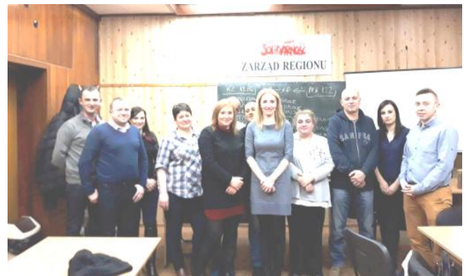
Wybory Komisji Oddziałowej w JMP S.A Biedronka w Łodzi

Do tej pory wybory odbyły się w 29 organizacjach związkowych. Wybrano także 13 delegatów na WZD Regionu (stan na dzień 12 lutego br.).